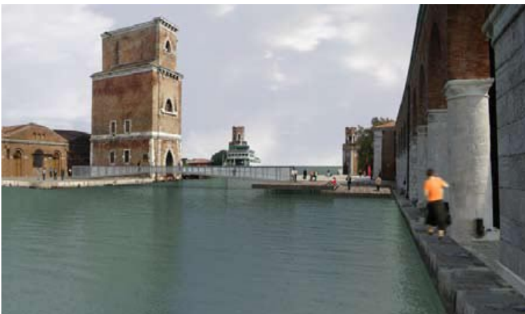
Ponte mobile, immagine di progetto