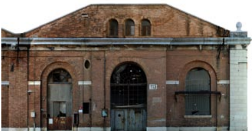
Tesa 113, stato attuale